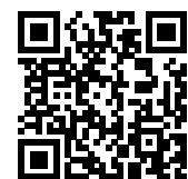
連絡メール2 保護者ログイン

* 保護者サイト https://renraku.education.ne.jp/parent/