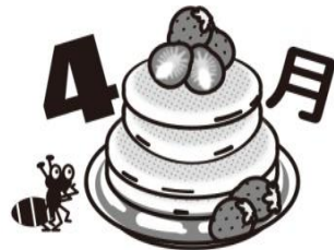
岸和田市立久米田中学校 保健室